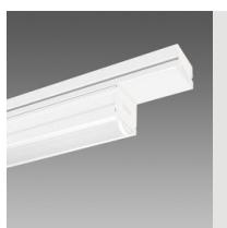
6605 Techno System - difusor semiesférico extensivo - CRI 90