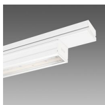
6602 Techno System - bi-asimétrico 25° - CRI 90