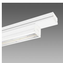
6601 Techno System - asimétrico 25° - CRI 90