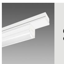
6616 Techno System HE - difusor semiesférico extensivo - CRI 80